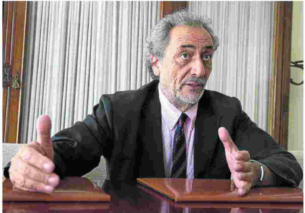
El Defensor del Pueblo Andaluz, José Chamizo, en una imagen de archivo.

Según algunos datos del citado informe, la población menor de 18 años en Andalucía alcanza 1.648.650, de los que 118.906 son menores extranjeros. Dentro del Sistema de Protección de Menores hay 6.299 tutelas, 120 guardas, 2.795 menores en acogimiento residencial, y 705 en acogimiento familiar. Además, las actuaciones judiciales en menores ascienden a 7.628, mientras que los chicos en tratamiento para el abandono de drogas o algún tipo de alcoholemia llegan a los 633, de los que un 26,3% de entre 14 y 15 años «consume alcohol los fines de semana, y solo un