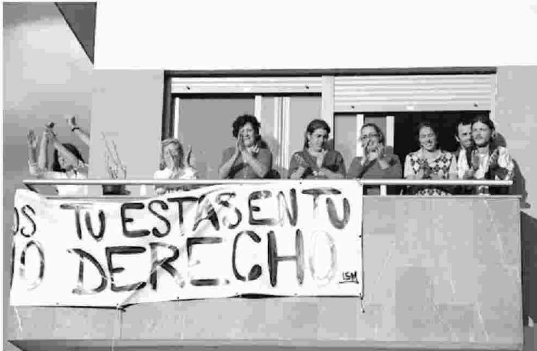
La mayor parte de las familias que han ocupado el edificio de San Lázaro han sido desahuciadas por entidades bancarias. CEBEDA