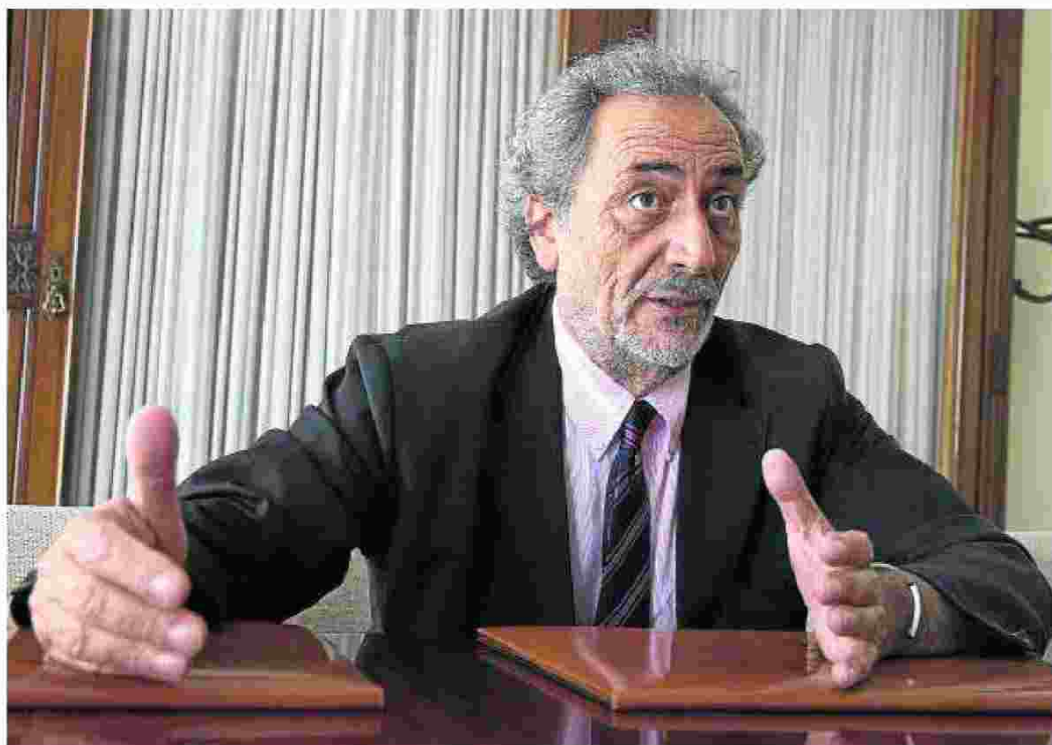
El Defensor del Pueblo Andaluz, José Chamizo, en una imagen de archivo. :: ÁLVARO CABRERA

Según algunos datos del citado informe, la población menor de 18 años en Andalucía alcanza 1.648.650, de los que 118.906 son menores extranjeros. Dentro del Sistema de Protección de Menores hay 6.299 tuteladas, 120 guardas, 2.795 menores en acogimiento residencial, y 705 en acogimiento familiar. Además, las actuaciones judiciales en menores ascienden a 7.628, mientras que los chicos en tratamiento para el abandono de drogas o algún tipo de alcoholemia llegan a los 633, de los que un 26,3% de entre 14 y 15 años «consume alcohol los fines de semana, y solo un