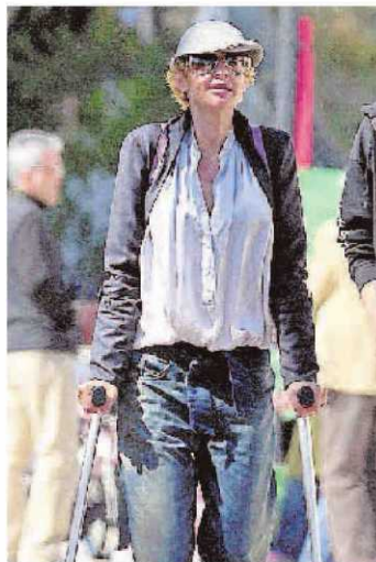
Arroyo obtuvo la invalidez. :: L.V.