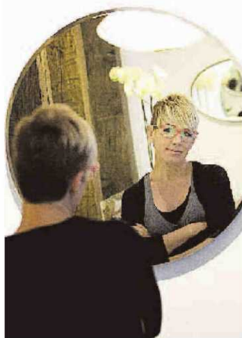
Torroja no sufrió lesiones graves.

En 1990 Esther Arroyo dejaba de ser una guapa anónima de Cádiz para convertirse en la más bella de España según un certamen que atravesaba por una etapa más boyante que la actual. Atrás quedaron sus años de estudiante en Amor de Dios y cómo pronto empezó a llamar la atención cuando bajaba a la playa La Victoria como una gaditana más. Un fotógrafo local le hizo las primeras instantáneas con cierto toque profesional, pero fue Miss España lo que catapultó a la modelo al centro del país y a las posibilidades laborales. Después llegarían sus papeles como actriz en Más que amigos o Periodistas y el honor de ser pregonera del Carnaval. El accidente la obligó, a partir de 2008, a centrarse en un largo periodo de rehabilitación que le alejó de los escenarios. El año pasado lo hizo oficial, la vida pública y con ella su carrera profesional se habían acabado.